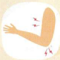
bolesti svalů a kloubů