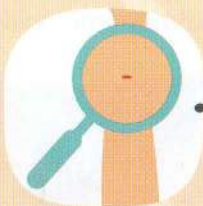
zarudlé místo po kousnutí, někdy s centrálním vyblednutím